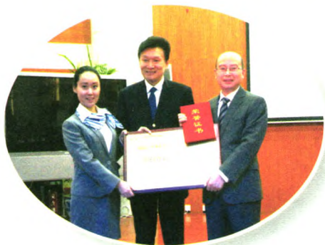
四川省成都市芳草小学被授予 “全国真语文·真教育示范基地”称号

2014年10月16日-17日,全国真语文系列活动在四川成都芳草小学举办。真语文系列活动总顾问贾志敏、张赛琴,上海师范大学小学语文教学研究中心副主任吴忠豪,以及全国各地500多位一线教师代表、教研员和语文教育专家参加了此次活动。