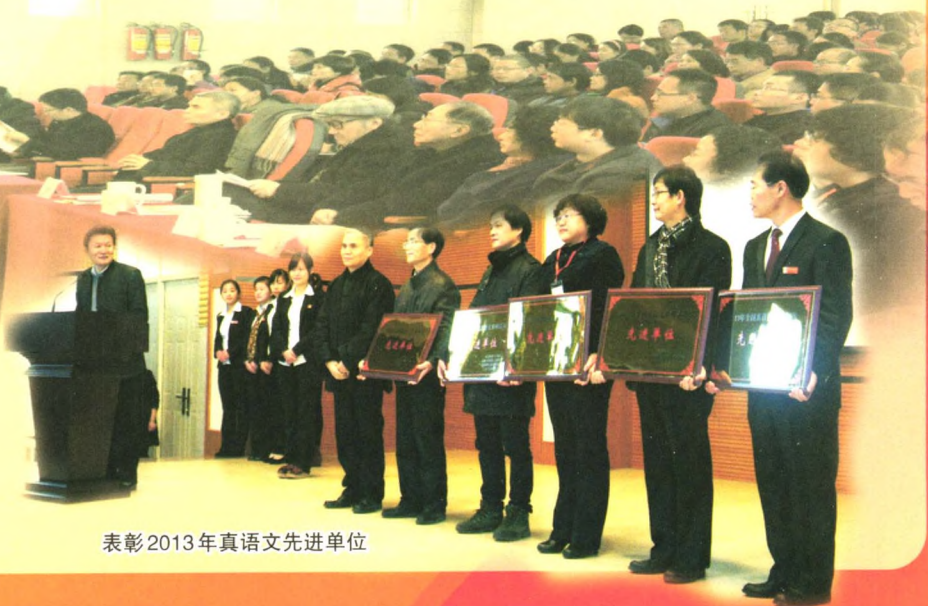
表彰2013年真语文先进单位