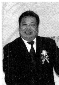
本期头条作者：李宇明