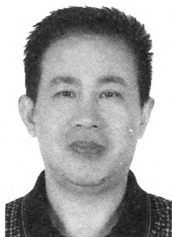
本期头条作者：程少堂