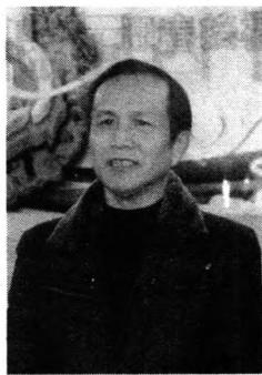
本期头条作者：谭根稳