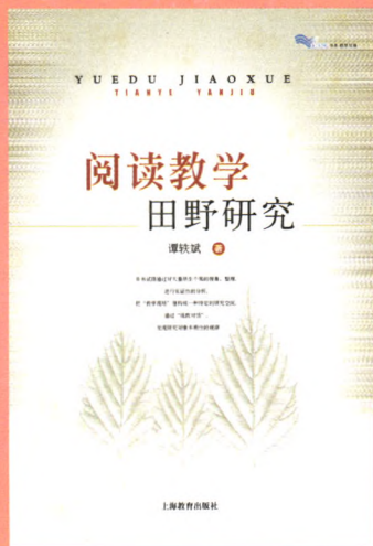
《阅读教学田野研究》 谭轶斌著，定价：25.00元 上海教育出版社2008年3月出版