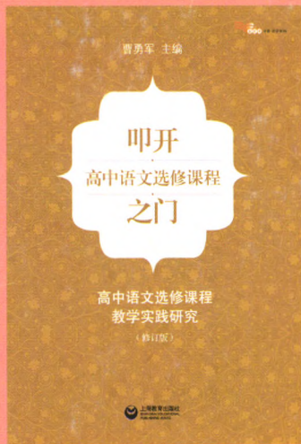
《叩开高中语文选修课程之门》(修订版) 曹勇军主编，定价：36.00元 上海教育出版社2013年9月出版