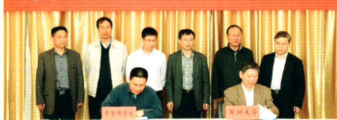
郑州大学、中国科学院联合举办“钱三强英才班”