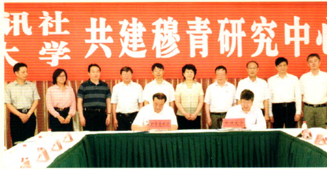
新华通讯社与郑州大学共建“穆青研究中心”