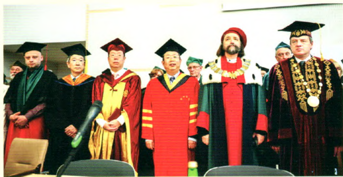
校长刘炯天院士出席罗兹大学校庆活动