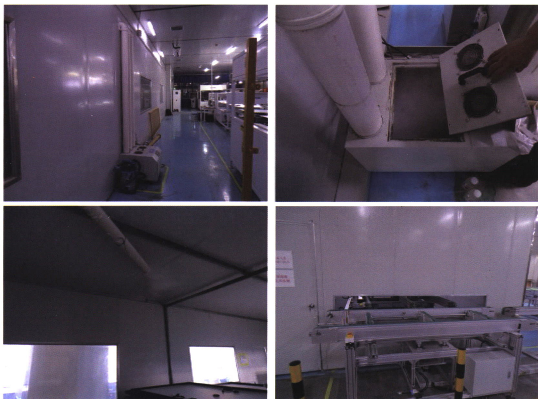
图2 加湿间内外工作布局