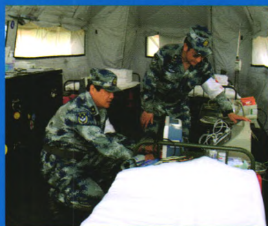
检查野战医疗设备