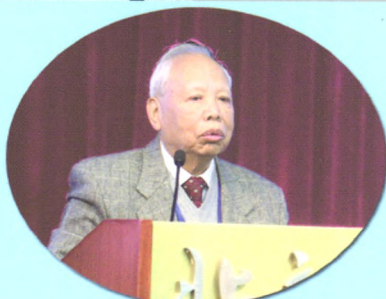
北京大学原党委书记、 医学教育家王德炳致辞