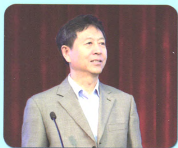
原卫生部副部长陈啸宏致辞