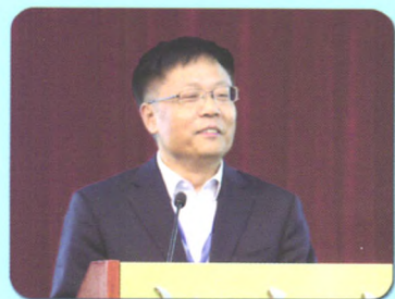
北京大学公共卫生学院 院长孟庆跃教授作报告