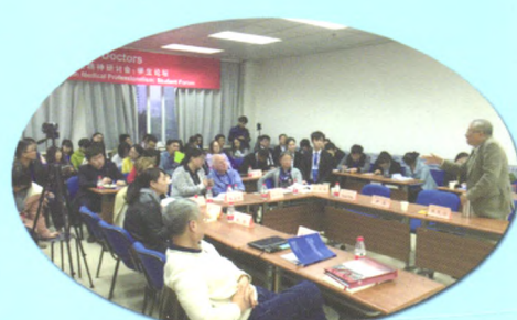
分会场“未来的医生”学生论坛