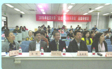
“走出医患关系困境”研修班会场