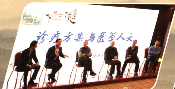
华润三九适道仁心医学与人文沙龙