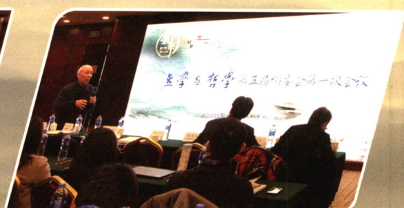
第五届编委会第一次会议