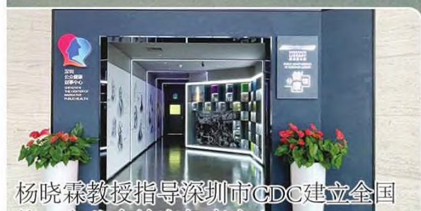
杨晓霖教授指导深圳市CDC建立全国首个生命健康叙事分享中心 覆盖数据超1000万方数据

生命健康叙事分享中心自2019年成立至今，已开展线上线下活动一百余场，参与人数多达50万人。其中叙事医学师资培养共5场，儿童生命叙事教育4场，医护人员心身关爱活动6场，叙事健康管理理念分享3场，患者家属生老病死教育和哀伤辅导7场，心脏病、肿瘤、哮喘、更年期、乳腺癌、帕金森等相关疾病叙事科普和病友生命故事分享活动50余场。中心的建设模式具有可复制性，能够为我国各大医科院校和医疗机构开展医学人文研究、叙事医学课程体系建设和临床医疗实践提供有益的借鉴。