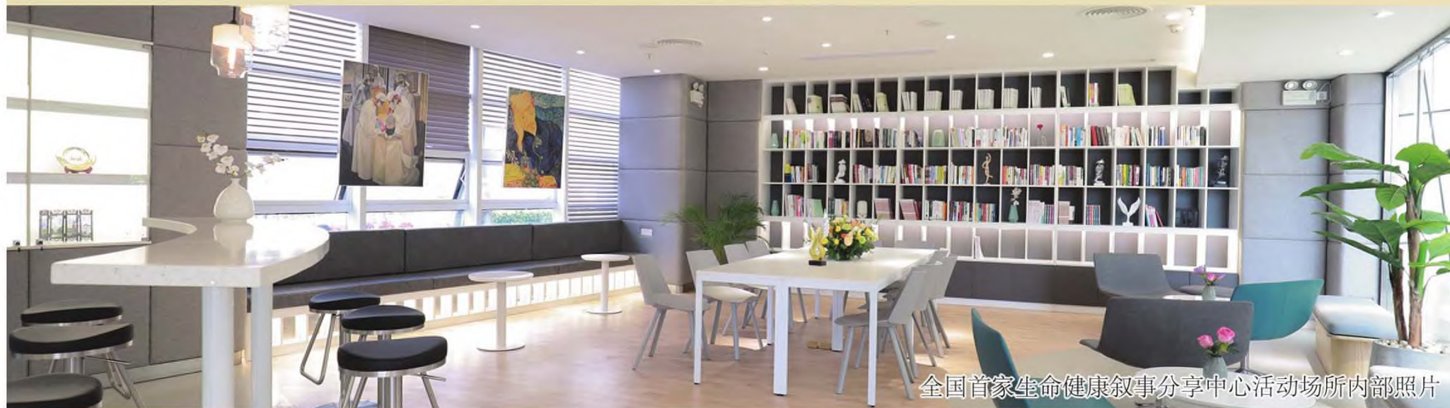
全国首家生命健康叙事分享中心活动场所内部照片

叙事医学研究中心自2018年成立至今，以医、护、患三大视角为切入点，收集、整理、发行叙事性作品与叙事性绘本近3000册，制作不同疾病相关的生命叙事小册子10余种，基本满足不同年龄人群的疾病认知和生命健康教育与健康管理需求。中心正在建设全国最大的生命健康叙事文本库。该文本库是适用于医疗系统的人文思政教育素材，对指导叙事医学教育和实践、培养高质量医学人才、加强医护人员职业人文教育具有开创作用。