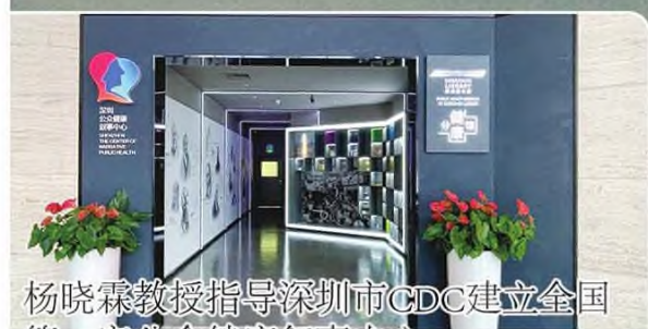
杨晓霖教授指导深圳市CDC建立全国首个生命健康叙事分享中心 万方数据

生命健康叙事分享中心自2019年成立至今，已开展线上线下活动一百余场，参与人数多达50万人。其中叙事医学师资培养共5场，儿童生命叙事教育4场，医护人员心身关爱活动6场，叙事健康管理理念分享3场，患者家属生老病死教育和哀伤辅导7场，心脏病、肿瘤、哮喘、更年期、乳腺癌、帕金森等相关疾病叙事科普和病友生命故事分享活动50余场。中心的建设模式具有可复制性，能够为我国各大医科院校和医疗机构开展医学人文研究、叙事医学课程体系建设和临床医疗实践提供有益的借鉴。