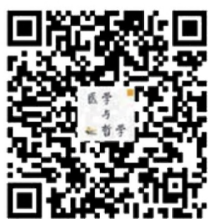
具体选题可扫描二维码

【投稿方式】本次大会只接收网上投稿，不接收 E-mail 和纸质投稿，请登陆大会网站： https://csme2021.sciconf.cn/ 进行在线投稿。文章字数以 6000 字以内为宜，要求学术论文摘要(300 字~500 字)。投稿截止日期为 6 月 30 日。