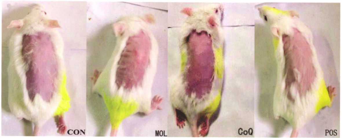
CON:空白组;MOL:模型组;CoQ:辅酶组;POS:阳性组