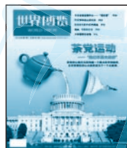
《世界博览》 海外卷/中国卷 国内代号 2-160 国外代号 M771