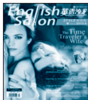
《英语沙龙》 国内代号 阅读版 82-506 时尚版 80-281 实战版 82-496 国外代号 M1251