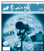
《世界知识》 国内代号 2-80 国外代号 SM20