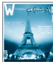
《世界知识画报》 国内代号 2-119 国外代号 M666