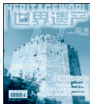
《世界遗产》 国内代号 80-681 国外代号 Q6990