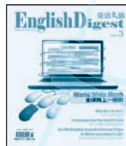
《英语文摘》 国内代号 2-716