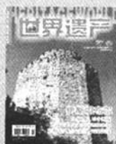
《世界遗产》 国内代号80-681 国外代号Q6990