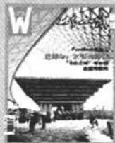
《世界知识画报》 国内代号2-119 国外代号M666