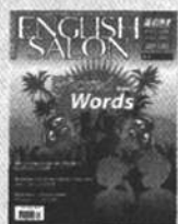
《英语沙龙》 国内代号 阅读版82-506 实战版82-496 国外代号 M1251