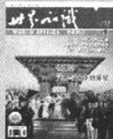
《世界知识》 国内代号2-80 国外代号SM20