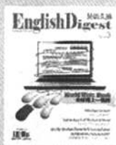
《英语文摘》 国内代号2-716