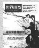
《世界博览》 海外版/中国版 国内代号2-160 国外代号M771