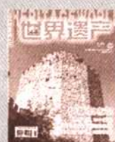
《世界遗产》 国内代号80-681 国外代号Q6990