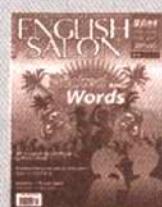
《英语沙龙》 国内代号 阅读 82-506 实战 82-496 国外代号 M1251