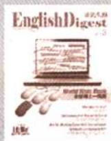
《英语文摘》 国内代号2-716