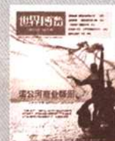
《世界博览》 海外卷/中国卷 国内代号2-100 国外代号M771