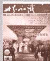
《世界知识》 国内代号2-80 国外代号SM20