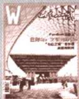
《世界知识画报》 国内代号2-119 国外代号M666