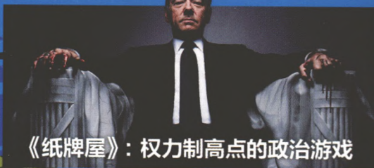
《纸牌屋》：权力制高点的政治游戏