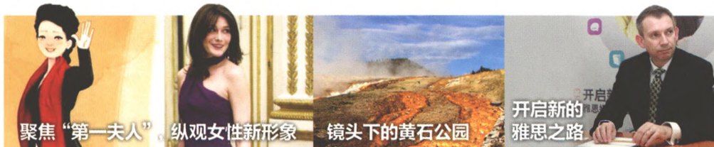
聚焦“第一夫人”，纵观女性新形象