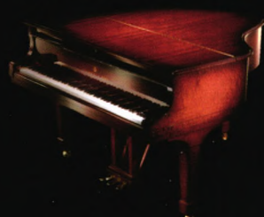
施坦威黄宝石钢琴