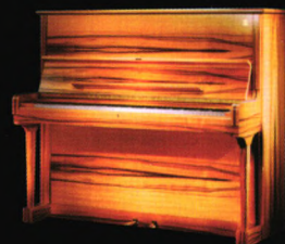
施坦威虎眼石钢琴