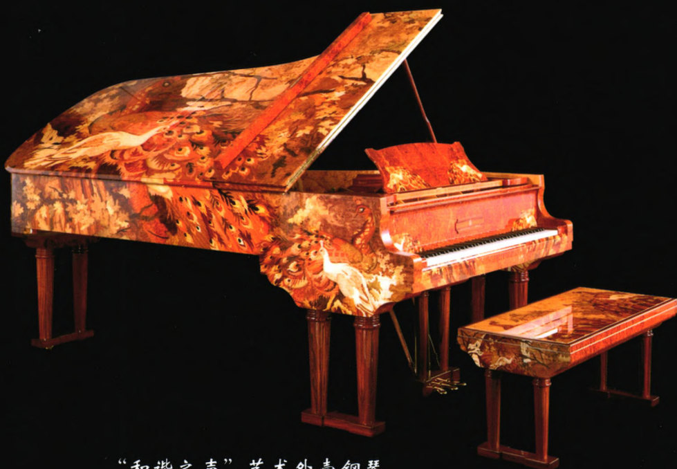
“和谐之声”艺术外壳钢琴