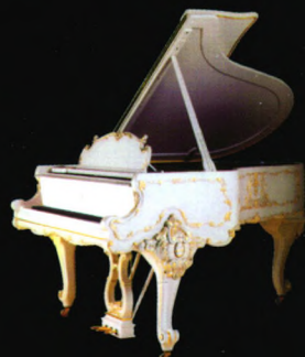
施坦威路易十五钢琴

发源于德国，以德国汉堡和美国纽约为生产基地， 施坦威钢琴凭借其158年的精湛手工工艺 与独创的128项专利技术， 被誉为“现代钢琴制造业的奠基者”， 早已成为全球2000多家顶级音乐厅、 1600多位著名施坦威艺术家、 100多所全施坦威学校的不二选择。