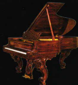
威廉姆·E·施坦威 限量版钢琴