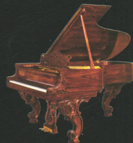
威廉姆·E·施坦威 限量版钢琴