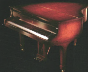
施坦威黄宝石钢琴