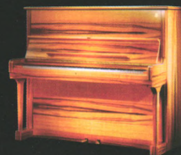
施坦威虎眼石钢琴