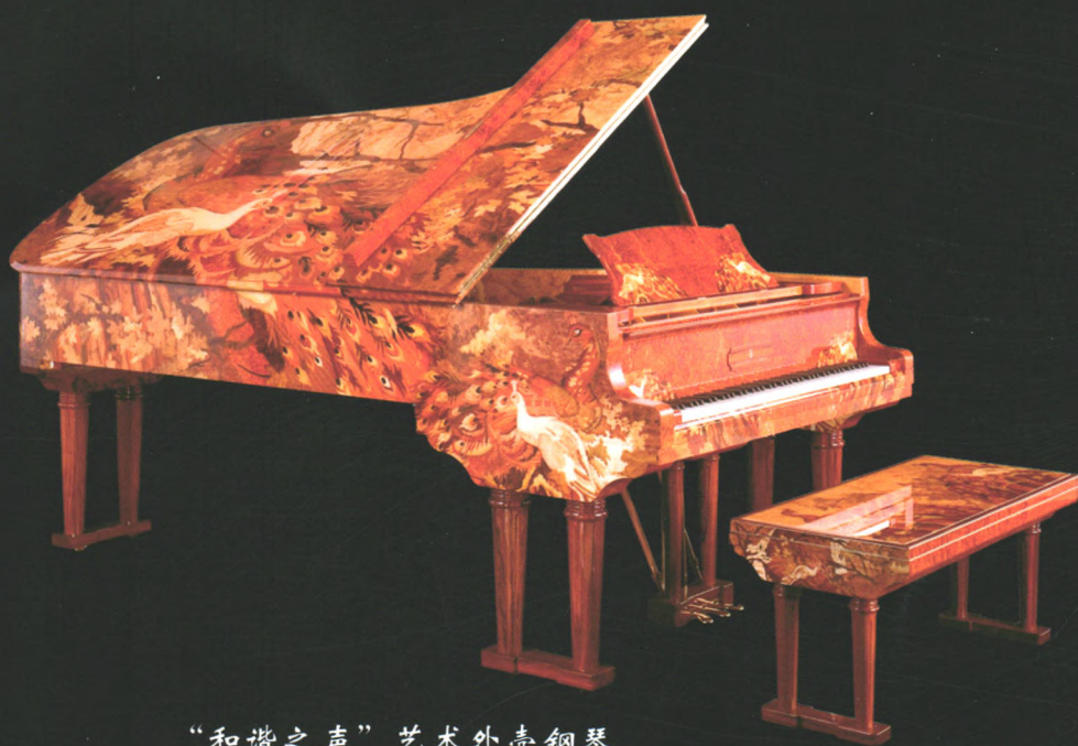
“和谐之声”艺术外壳钢琴