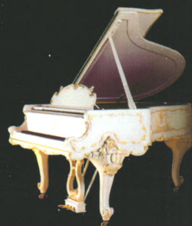
施坦威路易十五钢琴

发源于德国，以德国汉堡和美国纽约为生产基地， 施坦威钢琴凭借其158年的精湛手工工艺 与独创的128项专利技术， 被誉为“现代钢琴制造业的奠基者”， 早已成为全球2000多家顶级音乐厅、 1600多位著名施坦威艺术家、 100多所全施坦威学校的不二选择。