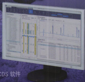
最新版 OpenLAB CDS 软件