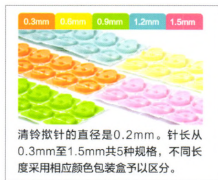
清铃揷针的直径是0.2mm。针长从0.3mm至1.5mm共5种规格，不同长度采用相应颜色包装盒予以区分。