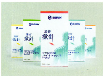
清铃揷针介绍网页: http://www.pyonex.info/