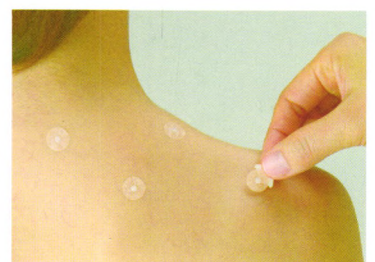
产品适用范围: 揷针被设计作为针灸治疗用的器具

清铃株式会社 (SEIRIN CORPORATION)，系日本的专业针灸针制造公司，创立于1977年，具有37年的制针历史。SEIRIN将传统的针灸医学理论与现代的针灸生产工艺技术相结合，1978年率先研发一次性无菌针灸针，1980年一次性无菌针灸针上市，享有盛誉。