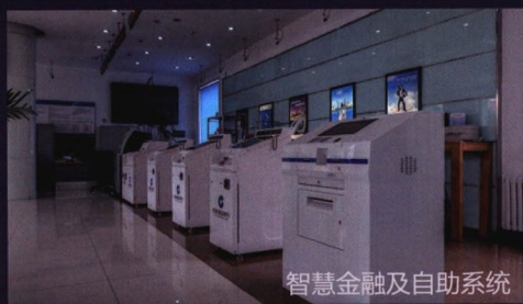
智慧金融及自助系统