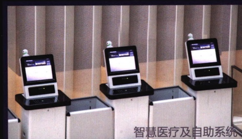
智慧医疗及自助系统