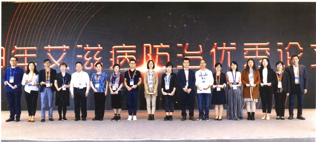
专家向优秀论文作者颁发证书