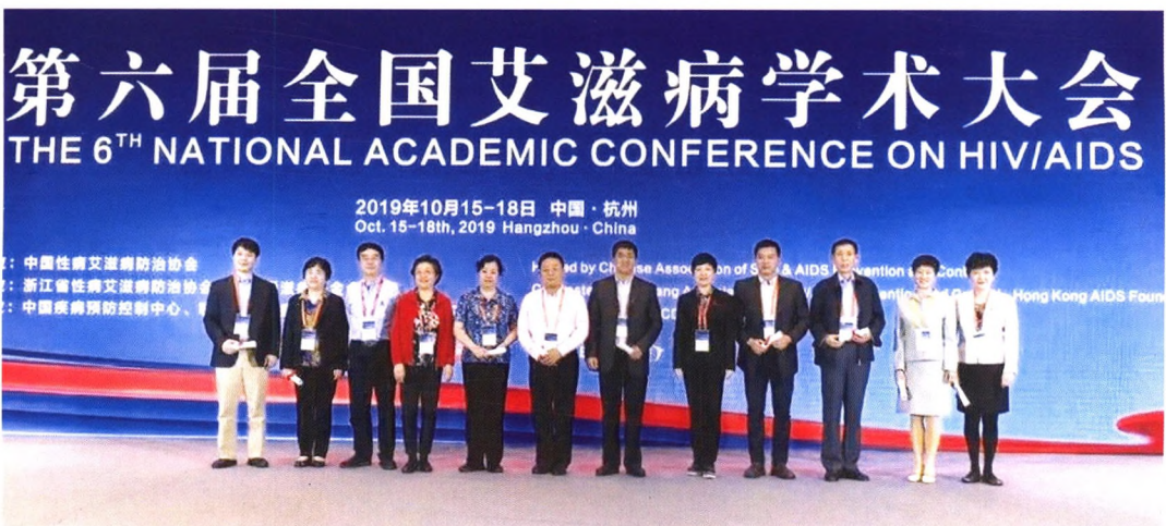
协会领导向分会场论坛坛主发致谢函