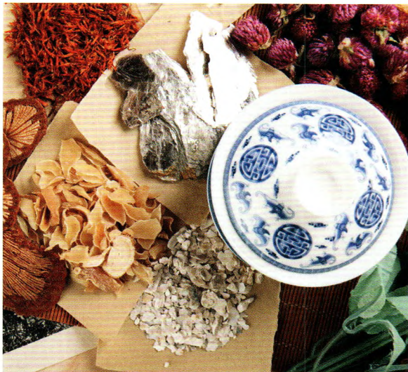
P34 我国大病保险五项制度的内涵探析