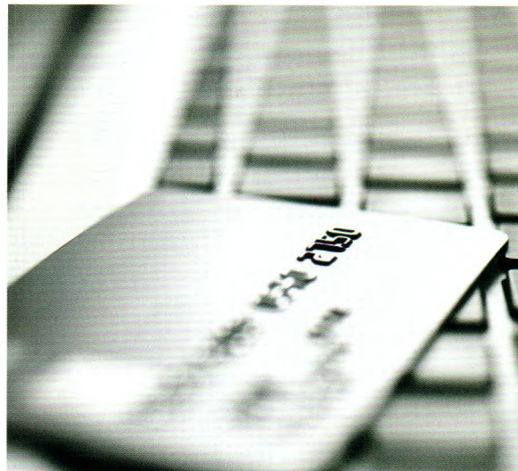
P51 信用保险之统保义务