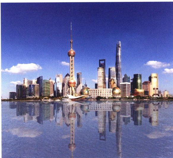
P27 建设工程质量潜在缺陷保险探析