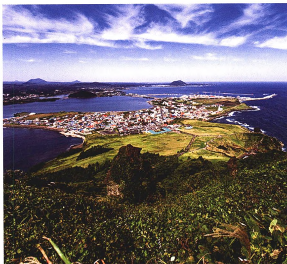
P61 韩国环境污染强制责任保险制度简介