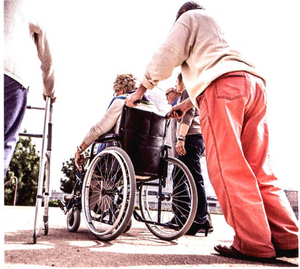
P60 德、日、韩长期护理险的运营比较及启发