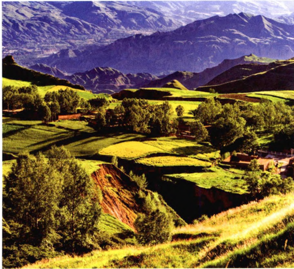
P34 青海省化隆县农业保险精准扶贫效率研究