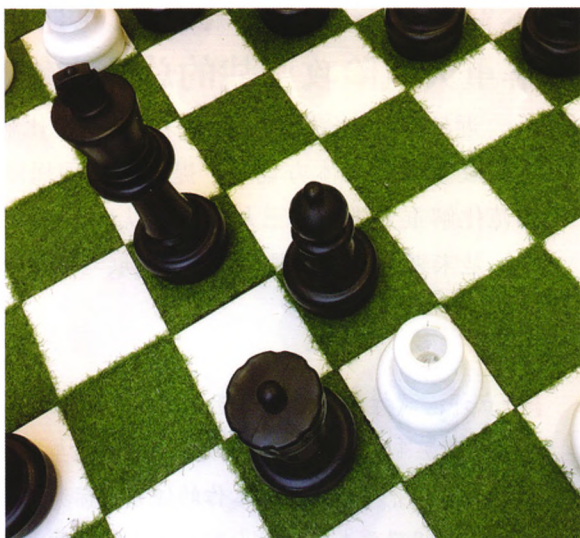
P29 政策性农业保险寻租行为的博弈分析