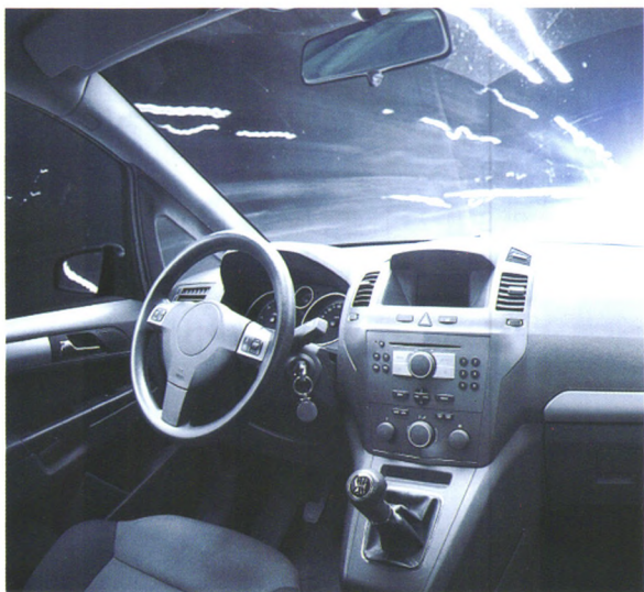
P34 全球财险业将面临颠覆性革命