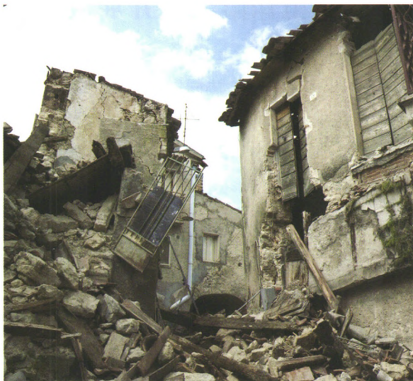
P58 日本、新西兰地震再保险制度对比及启示