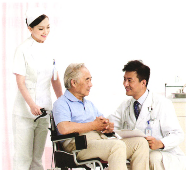
P31 “医养结合”下保险养老社区改进建议——“连锁”模式