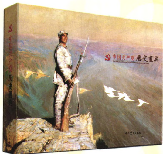
《中国共产党历史画典》（精装） 定价：1080.00元 顾问：欧阳淞 靳尚谊 主编：林宏伟 高永中