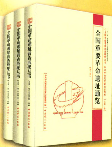
《全国重要革命遗址通览》 定价：860.00元 中共中央党史研究室科研管理部 编