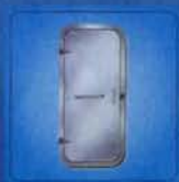
单把手快开闭钢质门