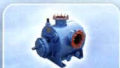
新型卧式双螺杆泵