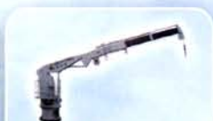
液压折臂伸缩起重吊机