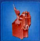
船用滚轮闸刀攀链器