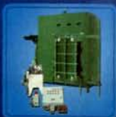
液压滑动式水密门