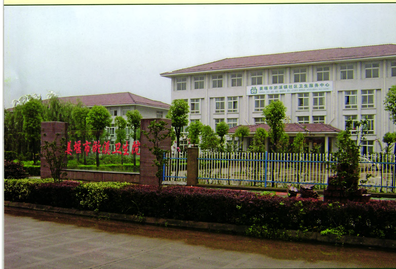
江苏省姜堰市淤溪卫生院