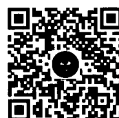
《中国初级卫生保健》官方公众号

欢迎扫描二维码关注《中国初级卫生保健》 官方公众号, 可查询稿件审理进度及相关信息