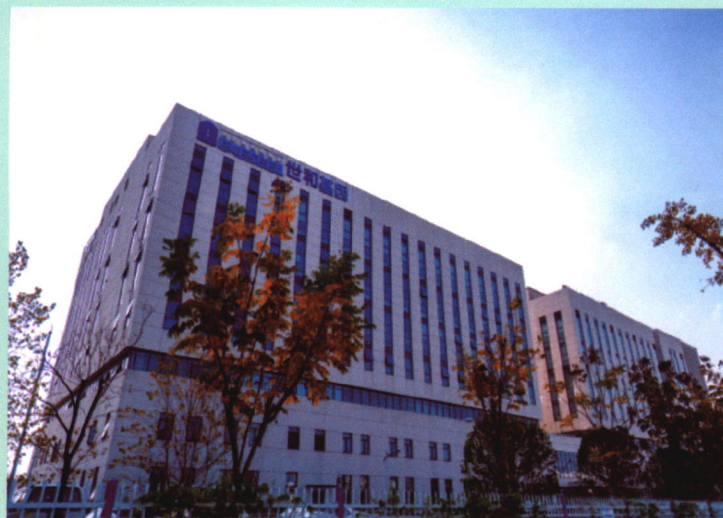
世和基因南京总部 I 期

世和基因于 2013 年由海归科学家团队创立,总部位于南京江北新区,致力于高通量基因测序技术的临床转化应用,主要开展肿瘤精准医疗基因检测,通过明确基因分型指导临床用药选择、提示耐药机制、监测术后复发,同时探索风险人群早筛早诊,为肿瘤精准医疗提供分子诊断服务和产品。世和基因是国家级高新技术企业,国家级专精特新“小巨人”企业,同时也是江苏发改委、科技厅及工信厅三认证的精准医学中心,检验实验室具备 CAP/CLIA/ISO15189 资质,并先后 400 余次通过国内外权威机构室内质评。世和基因拥有发明专利 33 项,已形成涉及一二三类医疗器械,覆盖肿瘤全周期诊断、治疗、预后和监测的产品管线。核心技术人员参与发表及公司参与临床研究项目发表文章近 500 篇,总影响因子超 4 000 分。