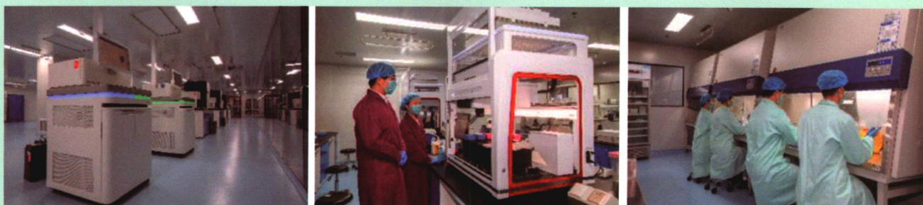
在中国南京及北美多伦多建有转化医学中心逾 20000 米 2