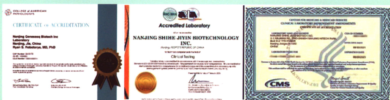
实验室具备 CAP / CLIA / ISO15189 三重国际认证

经过近十年的市场耕耘,世和基因已与全国 600 多家大型三甲及肿瘤专科医院建立长期合作,业务落地覆盖全国 25 个省市,累计检测肿瘤样本超 70 万例。同时,世和基因拥有自动化程度高的院内 NGS 一体化落地解决方案,从实验室建设、实验人员培训到生信分析、报告出具、质控体系建设,该方案已成功落地全国超百家三甲及肿瘤专科医院。