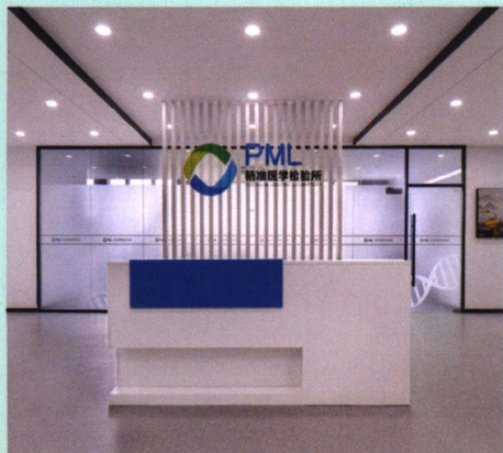
南京高新精准医学检验所

南京高新精准医学科技有限公司成立于2015年6月,下设南京高新精准医学检验所(以下简称“检验所”),是新区第一家国有控股的第三方医学检验单位。检验所自建成以来始终致力于促进先进优质的医学检验技术在临床的服务转化,聚焦临床化学检验专业、临床免疫、血清学专业及临床细胞分子遗传学专业下的深耕,秉承专业、高效、创新、合作的服务理念,服务内容涵盖肿瘤诊断、治疗、预后及检测的全流程。检验所建成1500平方米医学检验实验室和科研实验室,配备加强型生物安全二级实验室,拥有“采送检报”一体化信息系统,并搭建了基于荧光定量PCR、一代测序、二代测序、液相色谱串联质谱联用等多种专业技术检测平台,已累计满分通过50余次省级、国家级室间质量评价并获证书。目前检验所已和全国数十家综合性三甲医院和综合性大学建立了紧密的临床科研合作关系,为项目落地搭建一站式的服务方案。