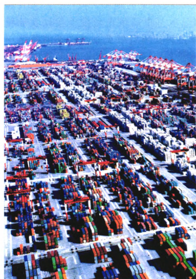
60 经济纵横 如何看待当前经济形势的变化