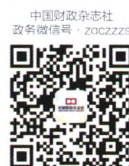
中国财政杂志社 政务微信号: zoczzzs

声明: 本刊已被《中国学术期刊网络出版总库》及CNKI系列数据库收录, 作者文章著作权使用费与本刊稿酬一次性给付, 如作者不同意文章被收录, 请在来稿时注明, 本刊将做适当处理。特此声明。