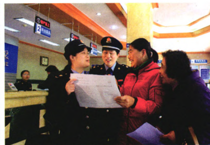
工作研究 44 《税收征收管理法》修订的几点建议