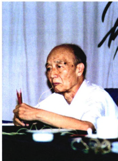
26 特别报道 心净无尘 身后无产 止水无波