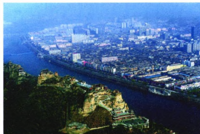
县乡财政 60 神木财政为县域经济发展插上“金翅膀”