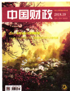
《中国财政》上期封面