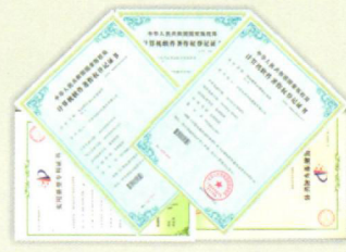
多项自有专利及 软件著作权证书