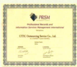
国际专业档案与信息管理服务协会 (PRISM International) 会员