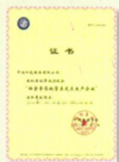
中国档案学会 “档案寄存托管定点企业”