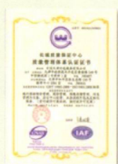
率先在外包服务六项专业 领域均获得ISO9001认证