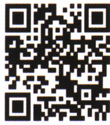
《中国当代儿科杂志》 投稿网站