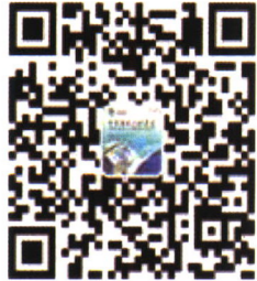
《中国当代儿科杂志》 微信公众平台

《中国当代儿科杂志》创刊于1999年，是由中华人民共和国教育部主管，中南大学及中南大学湘雅医院主办的国家级儿科专业学术期刊，为月刊。本刊宗旨“反映当代，面向世界”。