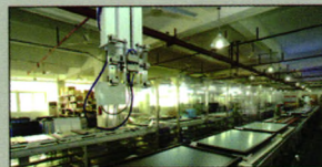
繁忙的自动数控“机械手”