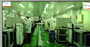
精密、高效、可靠的双SMT工艺线