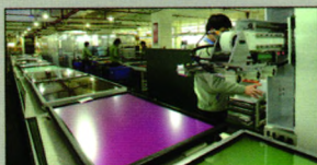
国际领先的交互智能平板生产线