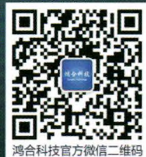
鸿合科技官方微信二维码