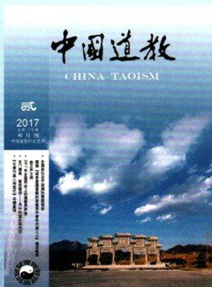
飞龙在天——第一洞天屋山