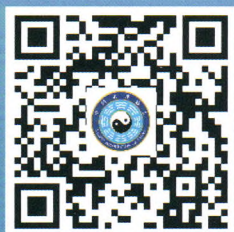
中国道教协会官网