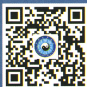
中国道教协会官网