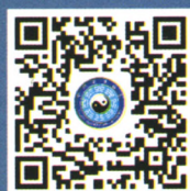
中国道教协会官方微博