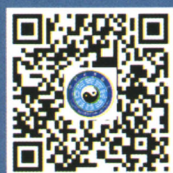
中国道教协会微信公众号