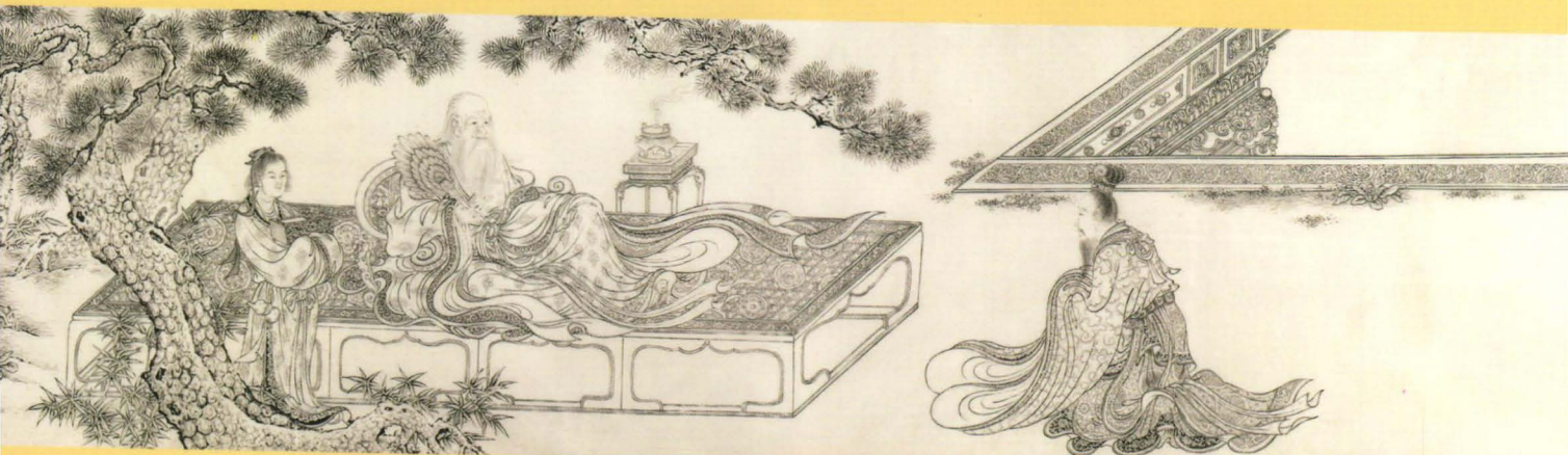
元代佚名 老子授经图 现代摹本