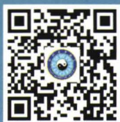
中国道教协会官网