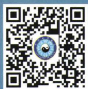
中国道教协会微信公众号