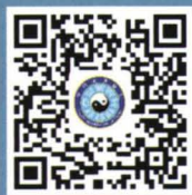
中国道教协会官方微博