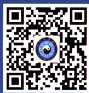
中国道教协会官网