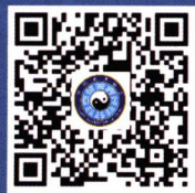
中国道教协会微信公众号