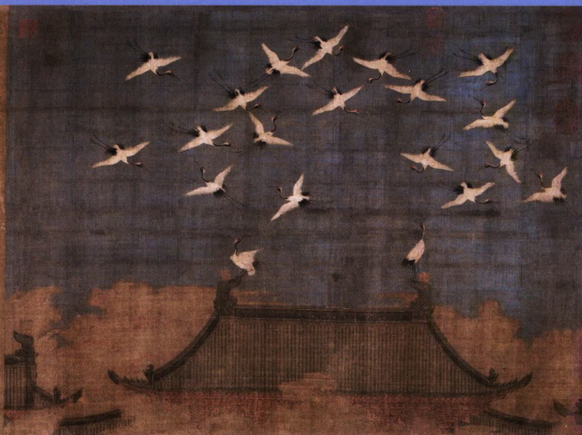
(北宋) 赵佶 瑞鹤图

政和壬辰上元之次夕忽有祥雲拂鬱 低映端門衆皆仰而視之倏有群鶴 飛鳴於空中仍有二鶴對止於鵠尾 之端顏甚闕道餘皆翔翔如應奏節 往來都民無不稽首瞻望歎異久之 經時不散迺還歸飛西北隅散感茲 祥瑞故作詩以紀其實 清曉飄旒拂彩霓仙禽告瑞忽來儀 元是三山侶兩翼還呈千歲姿似擬碧 霄棲寶閣豈同亦應集天池徘徊唳 唳當丹閣故使童孺俗知