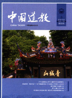
问道青城山