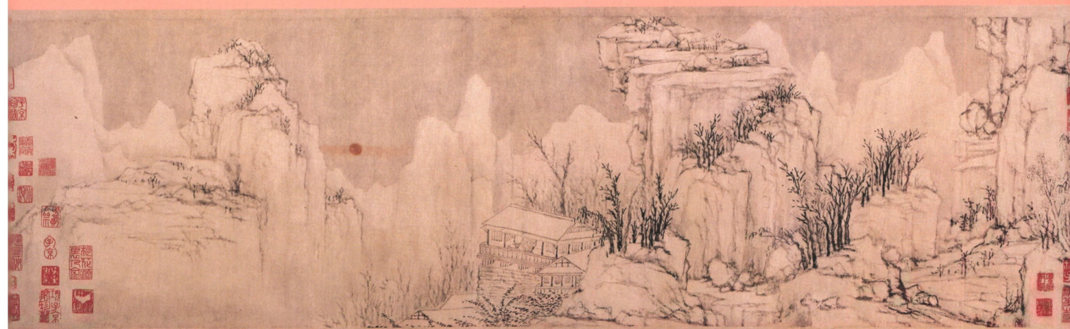
(元代) 黄公望 快雪时晴图